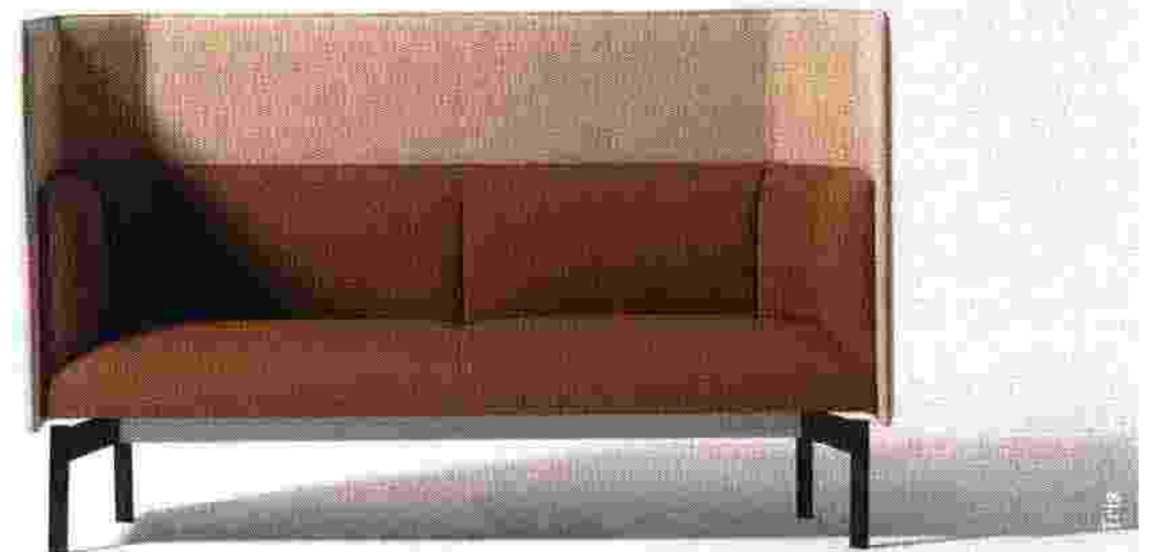
Kokoro Sofa, Manerba.