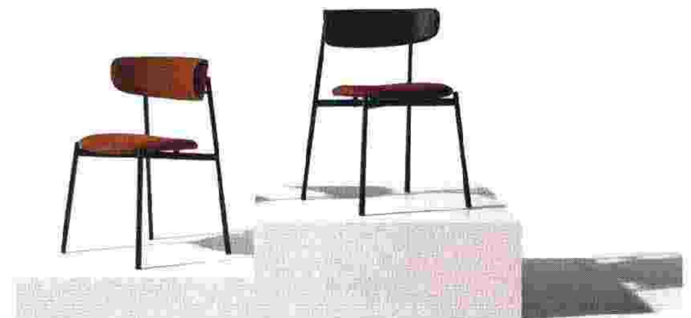
Collection Easy Chair, Manerba.