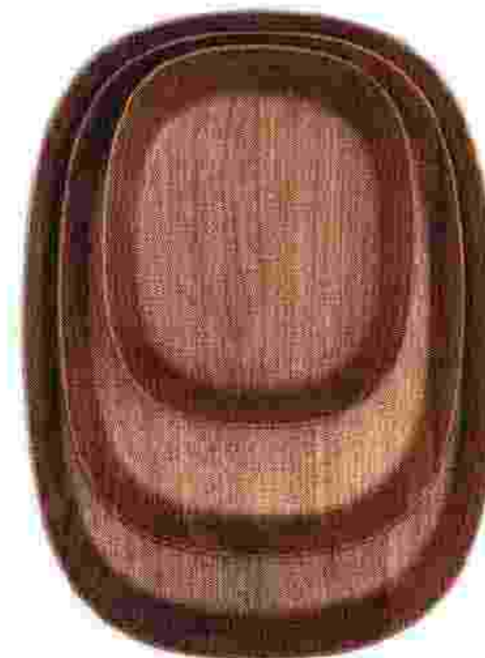
Bento, Coin Casa.