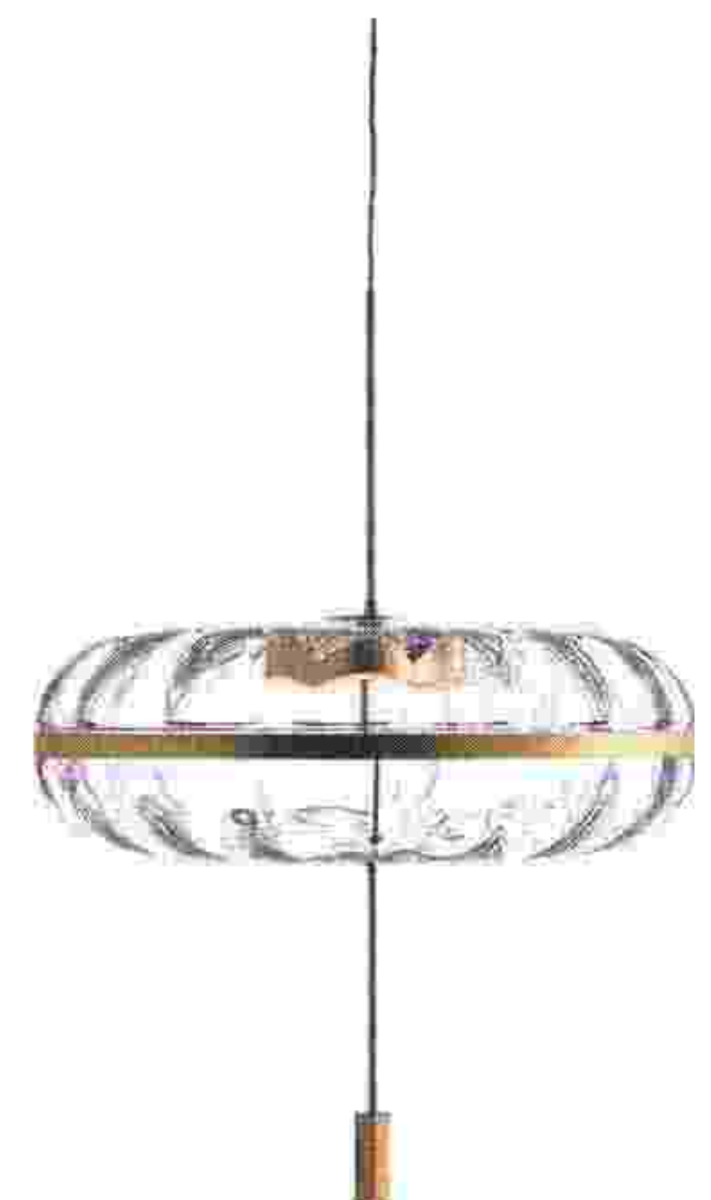
Suspension Jolie, Gallotti&Radice.