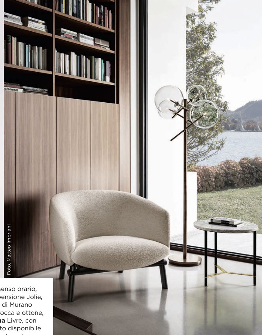
Qui e in senso orario, luce a sospensione Jolie, in vetro di Murano soffiato a bocca e ottone, e poltrona Livre, con rivestimento disponibile in pelle o tessuto e basamento in massello di frassino, entrambi per Gallotti&Radice; ceste Palù, in pelle intrecciata a mano, disegnate per il brand Rabitti 1969.