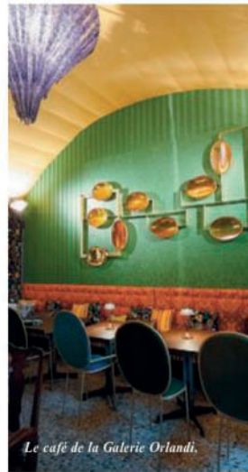
Le café de la Galerie Orlandi.