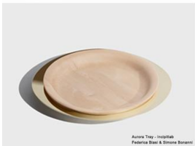
Aurora Tray - Incipitlab Federica Biasi & Simone Bonanni